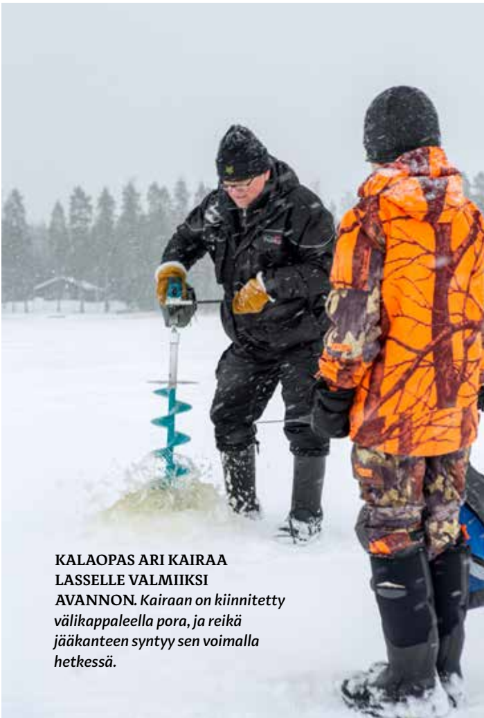
KALAOPAS ARI KAIRAA LASSELLE VALMIIKSI AVANNON. Kairaan on kiinnitetty välikappaleella pora, ja reikä jääkanteen syntyy sen voimalla hetkessä.