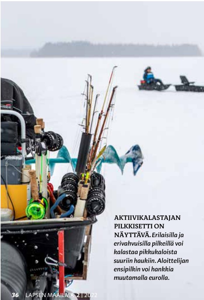
AKTIIVIKALASTAJAN PILKKISETTI ON NÄYTTÄVÄ. Erilaisilla ja erivahuisilla pilkeillä voi kalastaa pikkukaloista suuriin haukiin. Aloittelijan ensipilkin voi hankkia muutamalla eurolla.