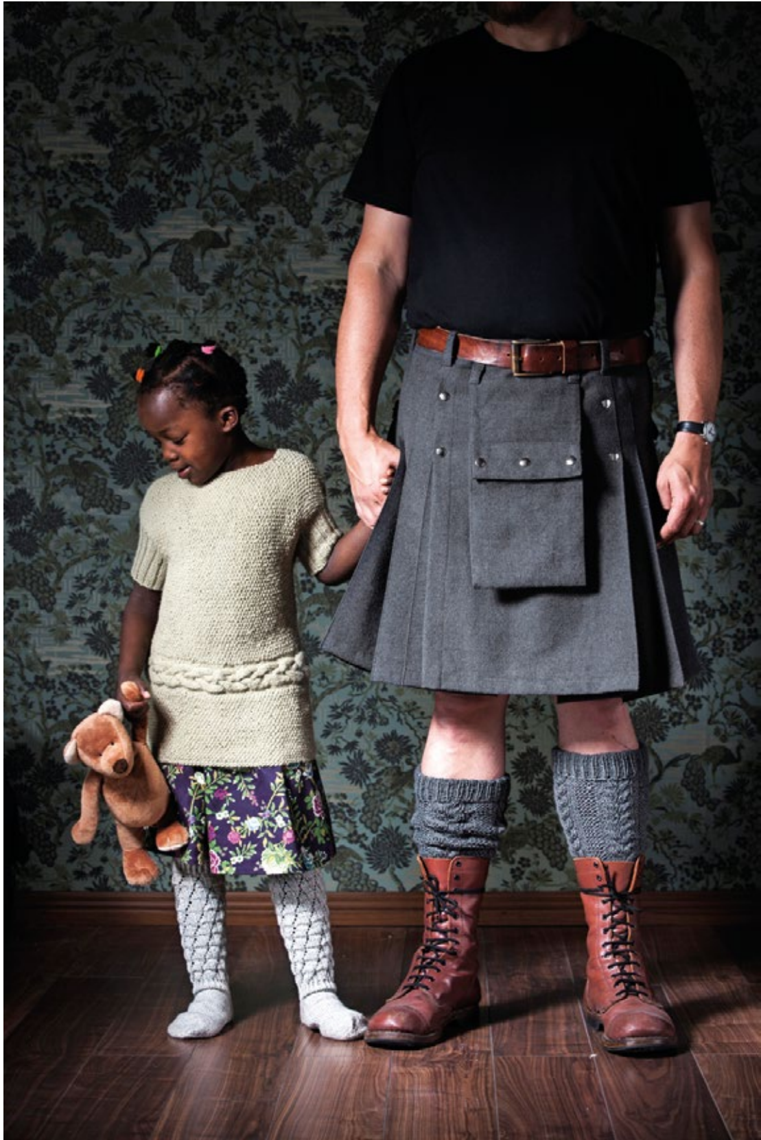
Vuoden lifestyle-kuva 2013. Kuva Mirva Kakko, suunnittelu & stailaus Hanna Tamminen, Kotiliesi 23/2013

"Onnistuneimmissa kuvissa on mukana aina jokin särö tai ristiriita. Kun kuvattava unohtaa olevansa kameran edessä, saa tallennettua usein hänen todellisen persoonansa." - Mirva Kakko