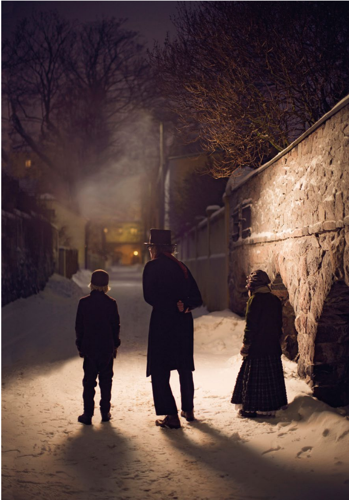
suunnittelu & stailaus Katri Schröder, Kotiliesi 26/2013