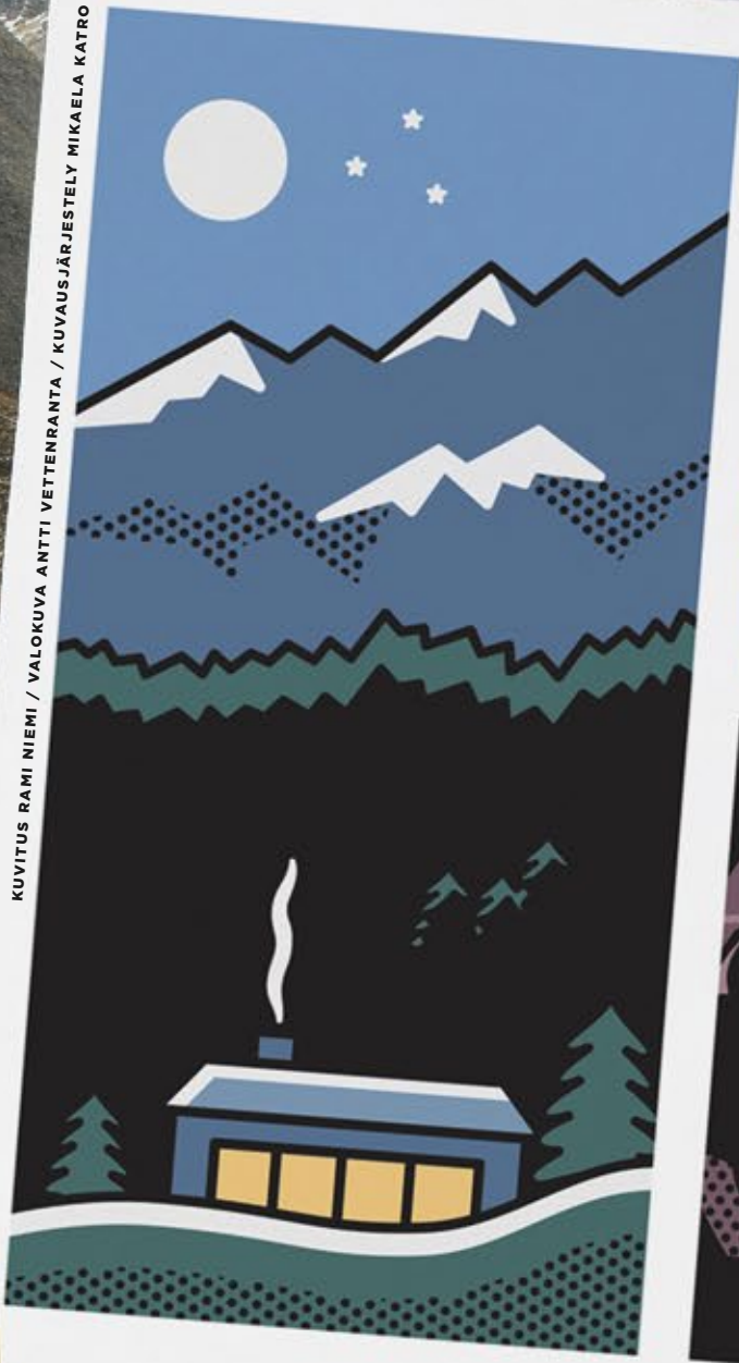
KUVITUS RAMI NIEMI / KUVAUSJÄRJESTELY MIKAELA KATRO