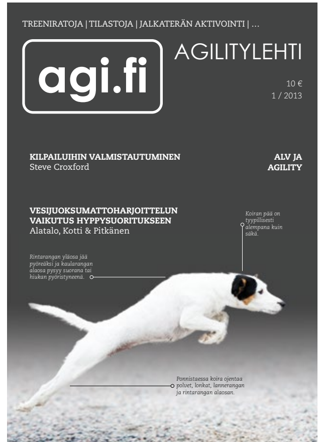
agi.fi agilitylehti 1/2013